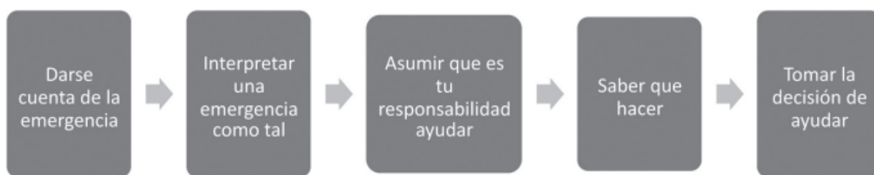
Figura 2. Proceso de toma de decisiones según Darley y Latané (1970). Tomado de Dialnet-UnaPropuestaDeIntervencionParaPrevenirElAcosoEscol-4489368.pdf

Partiendo de la concepción sobre el acoso escolar como problema social y de la existencia de numerosos programas de prevención e intervención, se plantea el presente proyecto; Es por ello, que al examinar las diferentes vertientes desde las cuales puede ser trabajado el acoso escolar, se considera orientar esta propuesta a modificar, principalmente, el rol del mediador, mediante el trabajo de la conducta social a través de su variable empatía. El proyecto se ubica dentro del apartado de propuestas de aula puesto que se trata de una acción planificada y fundamentada en la prevención y está construido sobre los cinco pasos de Latané y Darley (1970):