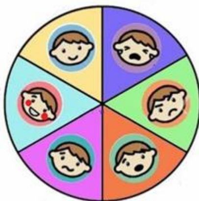
Ruleta de las emociones

A continuación se presenta una ejemplificación de la Ruleta de muestra, la cual se ajustará a las emociones mencionadas anteriormente.