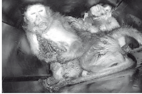
Imagen No. 5