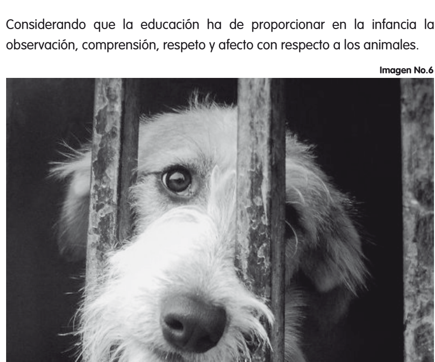
Imagen No. 6

Considerando que la educación ha de proporcionar en la infancia la observación, comprensión, respeto y afecto con respecto a los animales.