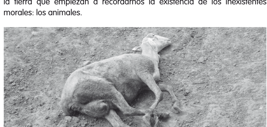
Imagen No. 1

Enhorabuena la filosofía, la ética, la bioética y hasta el derecho vienen con cierto asombro a descubrirlos y a pensar en ellos de otra manera desde los años setentas del siglo pasado. De la mano de un incipiente despertar ecológico de la conciencia, y de una tímida sensibilidad por los asuntos medioambientales, cada día empiezan a escucharse diferentes voces sobre la tierra que empiezan a recordarnos la existencia de los inexistentes morales: los animales.