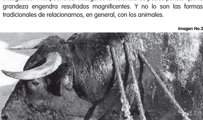
Imagen No. 2

O sería sensata y decorosa una posición humana antropocéntrica con otra lectura: si es que somos el centro entonces, vamos a suponerlo, todavía nos cabe más responsabilidad en la relación compasiva y comedida hacia los animales. Pues siendo "superiores" sería de esperar que actuáramos en consonancia con la grandeza: actuando con responsabilidad hacia toda forma de vida, sin egoísmos, compasivamente, con racionalidad y misericordia. Se supone que la grandeza hace ver más y mejor. Se supone que la inteligencia (si negásemos ésta en los animales) sería un privilegio autóctono desde el cual relacionarnos inteligentemente con todas las demás criaturas. Se deduce que de la inteligencia se derivan actos inteligentes. Y no podría ser inteligente la violencia. Se puede pensar que la grandeza engendra resultados magníficos. Y no lo son las formas tradicionales de relacionarnos, en general, con los animales.