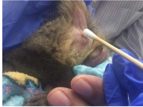
Imagen 5. Hisopado anal