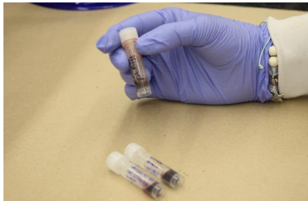
Imagen 8. Viales con muestras de tejidos