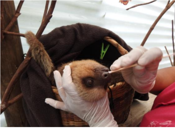
Imagen 4. Hisopado oral