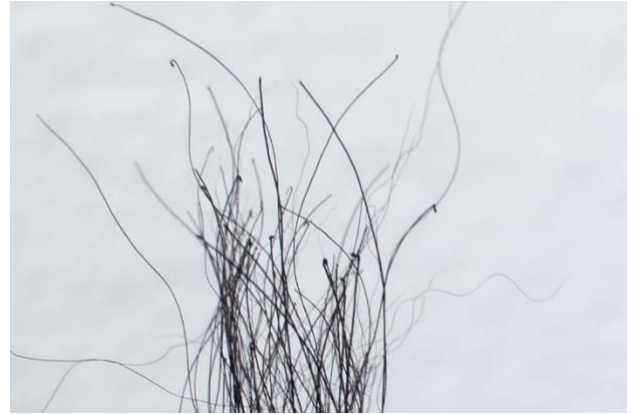
Imagen 7. Raíces de pelos.