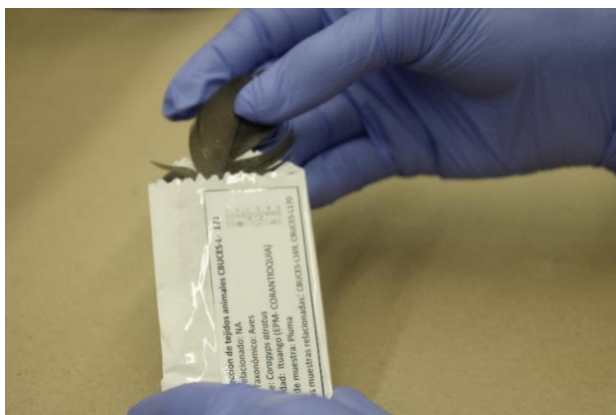
Imagen 9. Muestra debidamente etiquetada