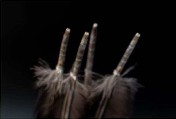
Imagen 6. Cálamos de plumas.