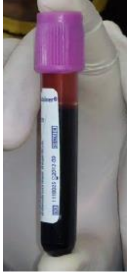
Imagen 3. Muestra de sangre líquida.