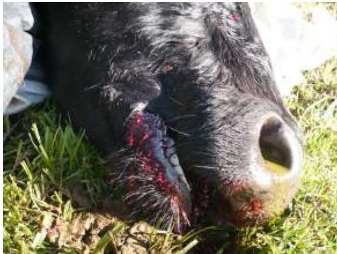
Figura 2. Secreción hemorrágica por cavidad oral.