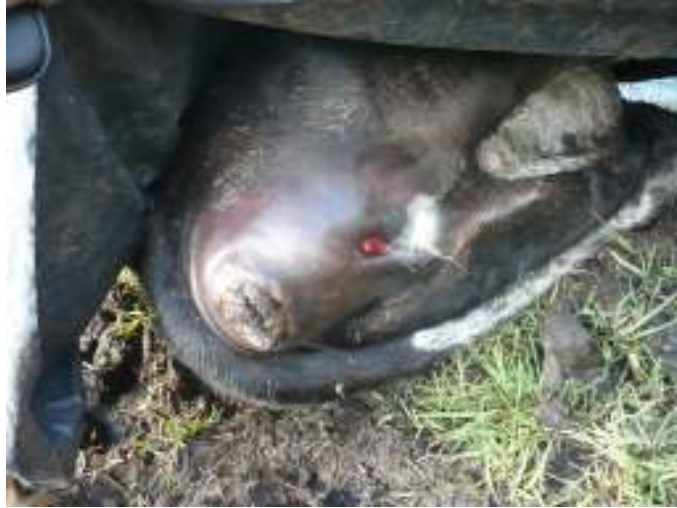
Figura 3. Protrusión en el recto por fuerte timpanismo