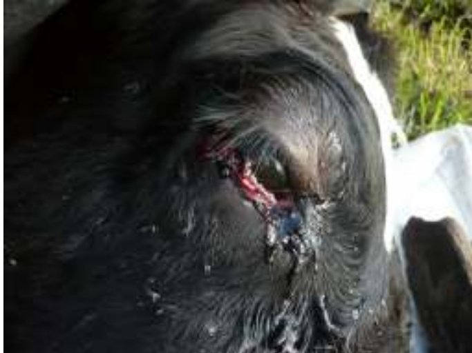
Figura 1. Secreción ocular hemorrágica