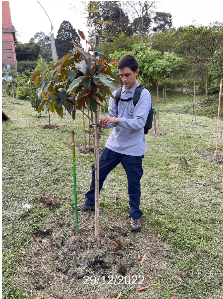
Figura 2. Mantenimiento y monitoreo de siembras urbanas