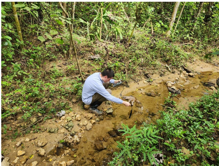
Figura 1. Caracterización ecosistemas acuáticos proyecto Cubika Caribe