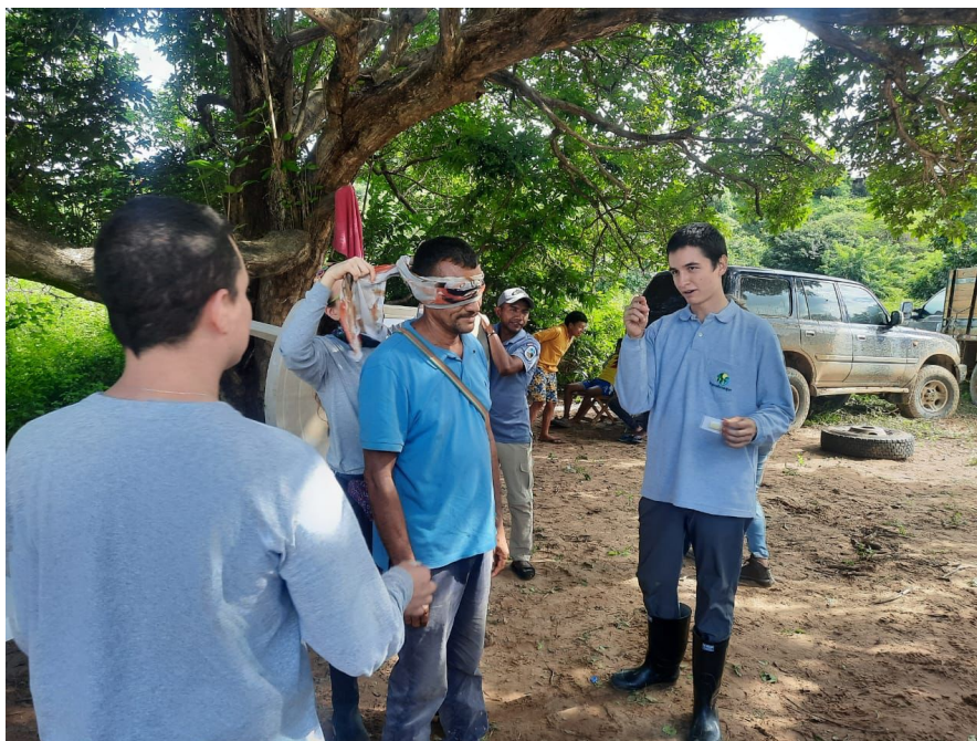
Figura 3. Talleres de socialización PCCB

La socialización del plan de compensación fue una experiencia enriquecedora, mi participación como facilitador en los talleres me permitió comprender la importancia de involucrar a las comunidades locales en los proyectos y garantizar su participación en la toma de decisiones. Además, fue evidente que la consulta previa y la construcción de acuerdos es una herramienta indispensable para lograr una compensación efectiva y justa para las comunidades afectadas por los proyectos. En resumen, esta práctica me permitió comprender la relevancia de las compensaciones en la gestión ambiental y la importancia de involucrar a las comunidades locales en este proceso.